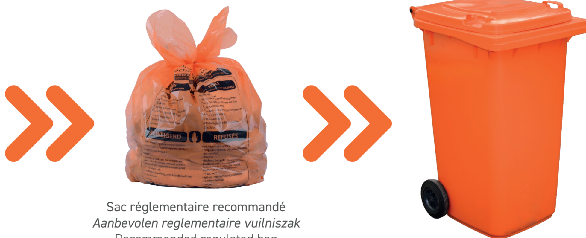
Sac réglementaire recommandé Aanbevolen reglementaire vuilniszak Recommended regulated bag